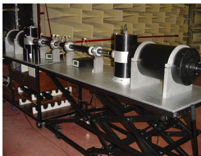
Conception sur mesure